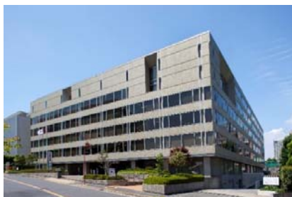
立哨と車寄せがある正面玄関