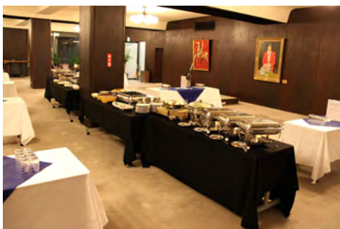
表彰式・総会後の懇親会に