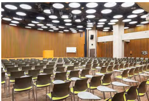
式典・シンポジウムに