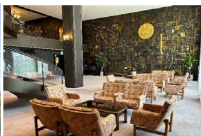
機械振興倶楽部（5階）