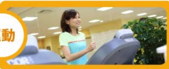
フィットネスジム