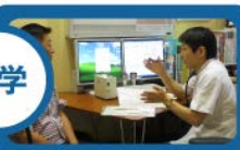
つみのり内科クリニック